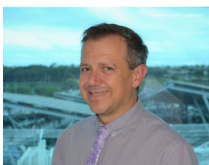
BOCOVIZ Claude DSC CFE-CGC

Les syndicats FO, CFE-CGC et CFTC ont pris leurs responsabilités en signant les accords de compétitivité. Maintenant, c'est à la Direction de respecter ses engagements en termes de charges et d'emplois !