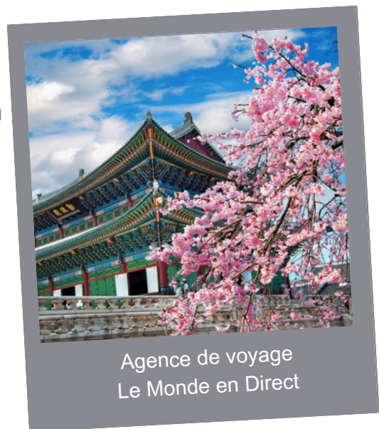
Agence de voyage Le Monde en Direct