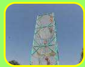
Tour de grimpe